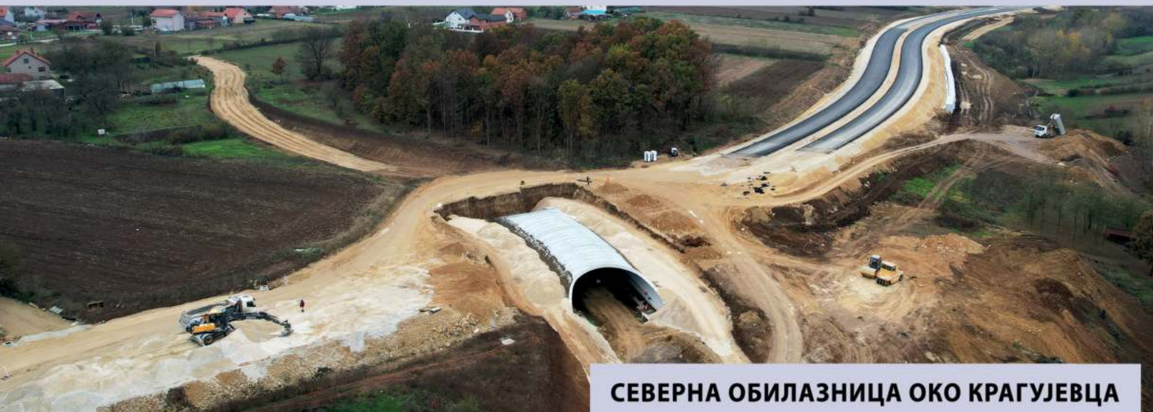
СЕВЕРНА ОБИЛАЗНИЦА ОКО КРАГУЈЕВЦА