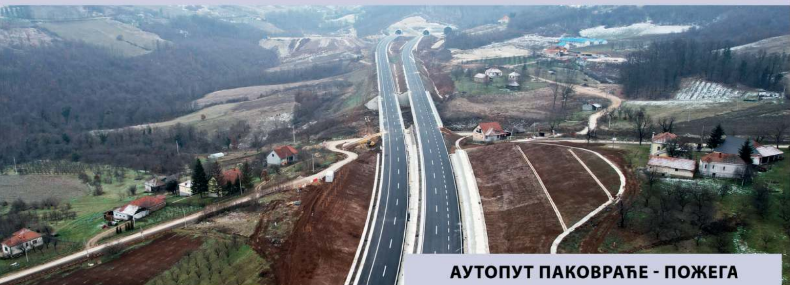
АУТОПУТ ПАКОВРАЋЕ - ПОЖЕГА