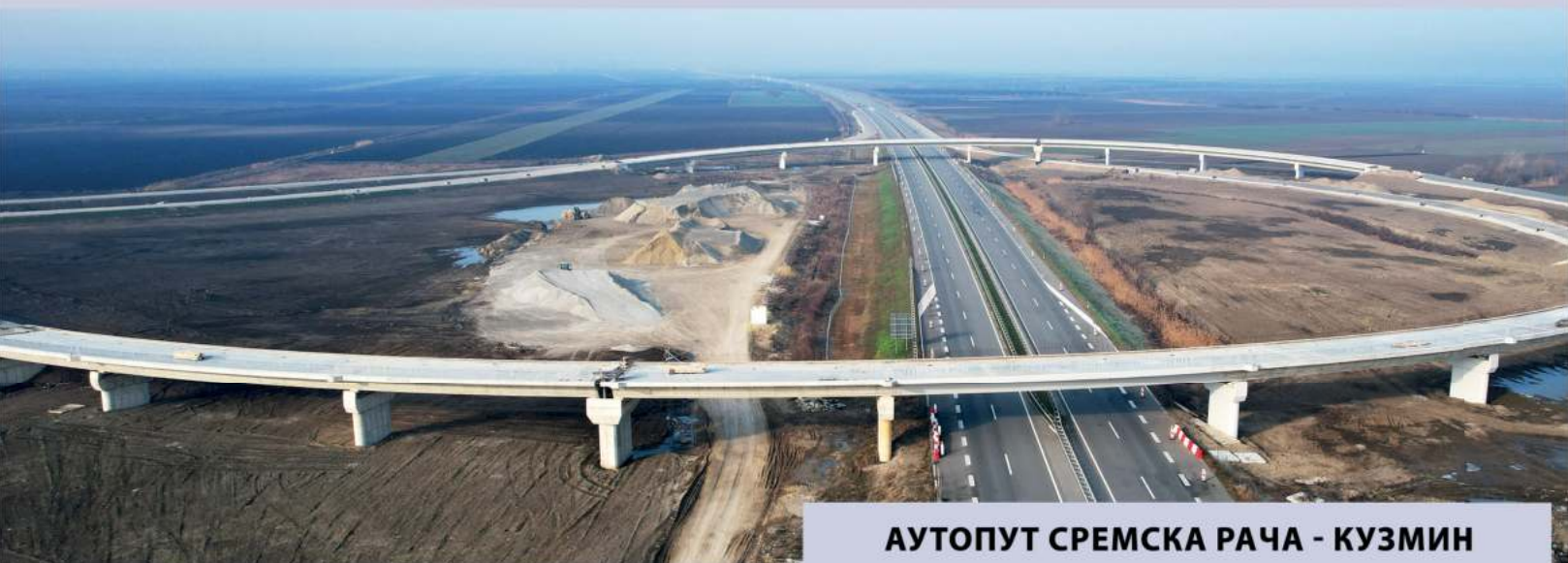
АУТОПУТ СРЕМСКА РАЧА - КУЗМИН